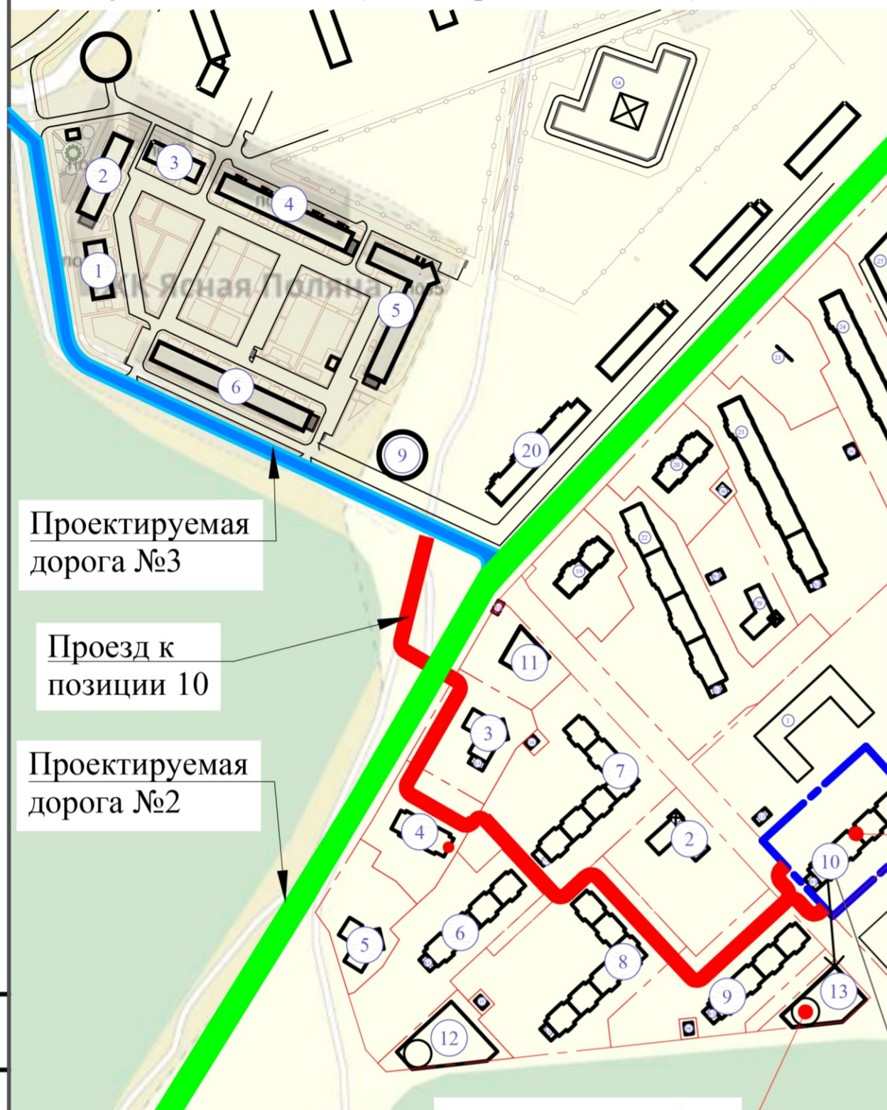
Ситуационный план (схема проезда к поз.10), М1:5000